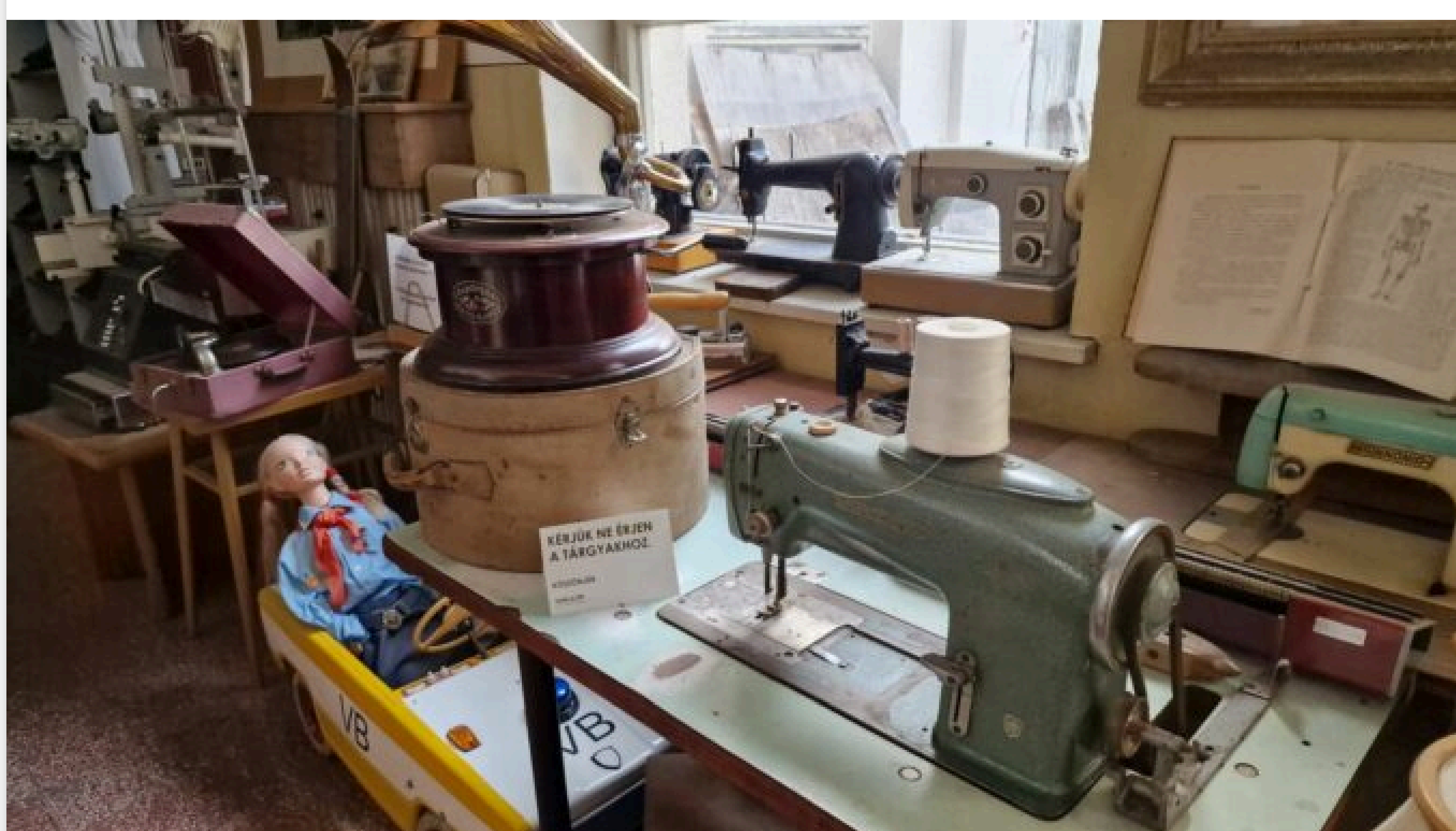
muzeum parkan foto majko 3 676x381 170421.jpg