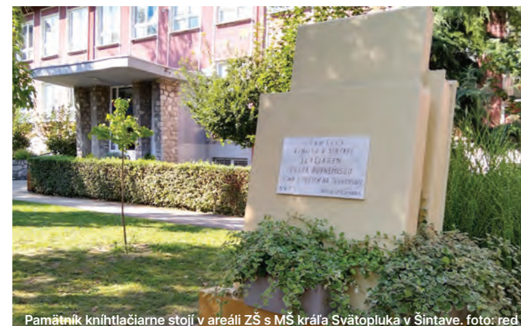
Pamätník kníhtlačiarne stojí v areáli ZŠ s MŠ kráľa Svätopluka v Šintave.